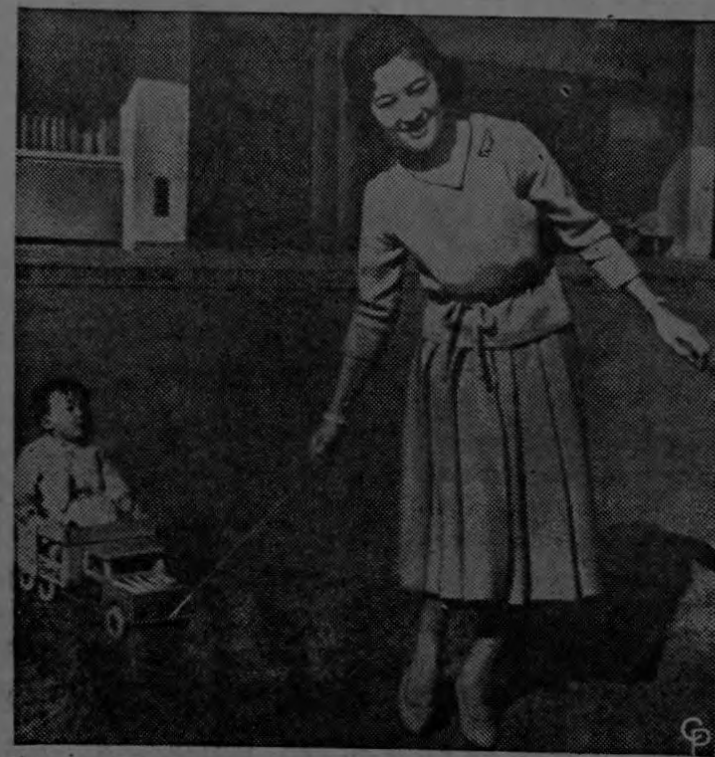
La Princesa Michiko, de Japón, pasea con su hijo, el Príncipe Hilo, en el jardín del Palacio Imperial de Tokio. El pequeño segundo de su padre en línea directa para ser Emperador. Este es el primer hijo del Príncipe Akihito